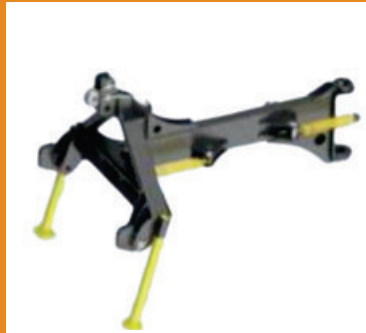
Anbaurahmen für Traktor