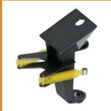
Anbaukonsole für Bagger