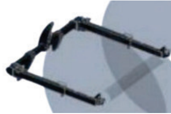
Frontanbau für Kabeltrommel